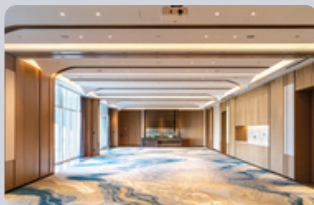
Salones de Eventos