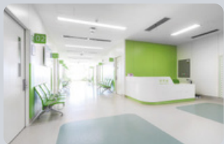
Centros de Salud