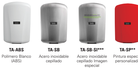
TA-ABS Polímero Blanco (ABS)